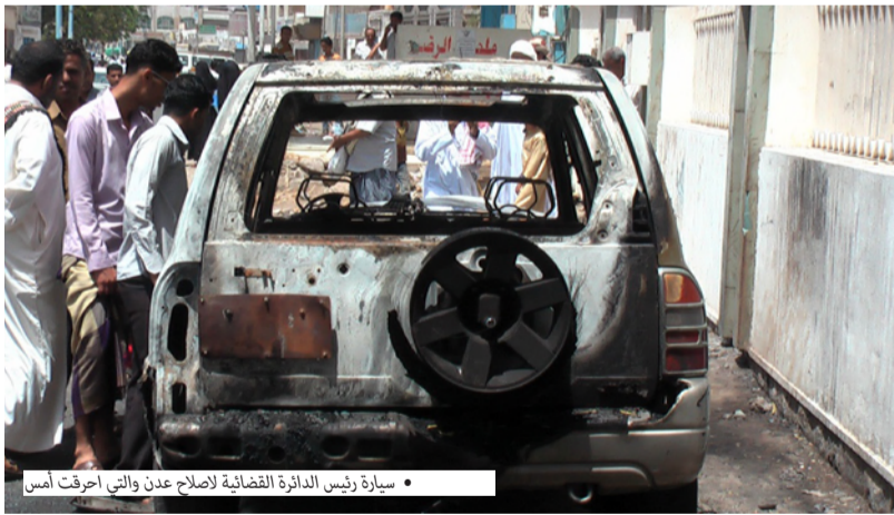
• سيارة رئيس الدائرة القضائية لاصلاح عدن والتي احترقت أمس

مجهولون يحرقون سيارة رئيس الدائرة القضائية لاصلاح عدن