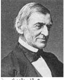
والف والدو إيمرسون

شاعر وكاتب أمريكي - عاش بين 1803-1882 ميلادي.