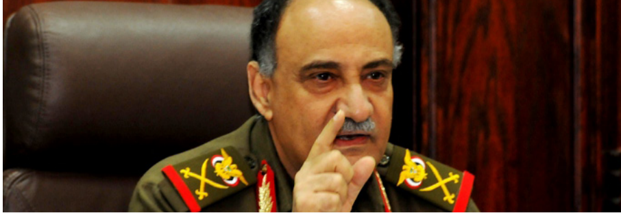
أحمد عوض بن مبارك أن أبناء الشعب اليمني كافة يعلقون الآمال الكبيرة في أن مؤتمر الحوار الوطني سيشكل نقلة نوعية التغيير وبناء اليمن الجديد. من جانبه أكد الأمين العام لمؤتمر الحوار الوطني الدكتور

وقال: نحن على ثقة بأن هذه العقول النيرة ستقفز على جمود الفكر والتزمّت للانطلاق نحو القضايا المحورية والمهمة لمناقشتها والتي ستسهم بالتأكيد في بناء الدولة اليمنية الحديثة. المشاركون أكدوا على أهمية إعادة الاعتبار للوحدة اليمنية من خلال تنقيتها من كل شوائب الماضي، ومعالجة الحقوق للناس وتسوية أوضاعهم انطلاقاً من الشراكة في الثروة والسلطة.