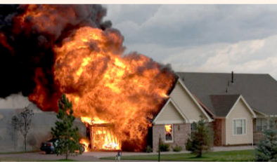
الحريق في منزل

اتهمت امرأة سويدية كلب الجيران "كوفو" باغتصاب كلبتها "تريسا" وأن الكلبة قد حملت منه، وقامت هذه المرأة برفع دعوى بالمحكمة ضد الجيران لإجبارهم دفع غرامة مالية من أجل إخضاع الكلبة لـ"الكورتاج" يعني الاجهاض، ولعقاب الجيران لعدم تربيتهم الكلب. بدورهم رفض الجيران هذا الاتهام رفضاً قاطعاً، لأن "كوفو" من "أكثر الكلاب أذبا وليس من شيمه فعل ذلك، وسور الفيلا عالي ومن غير الممكن اجتيازها". ولحل المشكلة قامت مجموعة من رجال الشرطة بمعابنة الفيلا التي يقطن فيها "كوفو"، فوجدوا أنه من المستحيل خروجه من الفيلا، وبعد بحث طويل وجدوا سرداب طويل حفره "كوفو" يصل بينه وبين "تريسا" ليفعل فعلته، وعلى أثر ذلك حكمت المحكمة على أصحاب الكلب بدفع غرامة مالية قدرها 7.000 "كرون" لإجراء "كورتاج" للكلبة لأن أصحابها لا يشرفهم أن تحبل كلبتهم من غير نوعها.